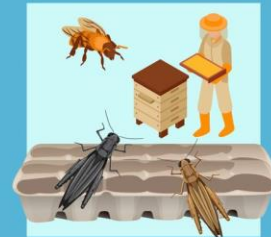
แมลงเศรษฐกิจ 10-20 รัง (แล้วแต่ชนิดแมลง)