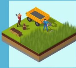
ข้าว 1 ไร่