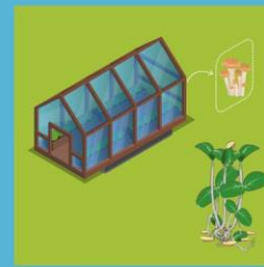
เพาะเห็ด ทำผักงอก เนื้อที่ 30 ตร.ม. (อย่างไรอย่างหนึ่งหรือรวมกัน)