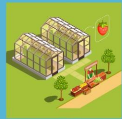
เพาะปลูกในโรงเรือน เนื้อที่ 72 ตร.ม.