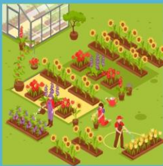
ไม้ดอก 1 งาน (อย่างไรอย่างหนึ่งหรือรวมกัน)