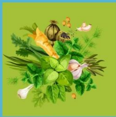
สมุนไพร 1 งาน (อย่างไรอย่างหนึ่งหรือรวมกัน)