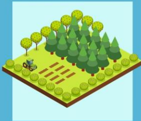
เกษตรผสมผสาน 1 ไร่ (อย่างไรอย่างหนึ่งหรือรวมกัน)