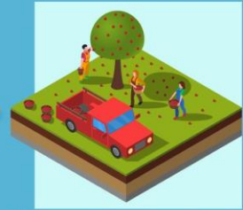
ไม้ผล หรือไม้ยืนต้น 1 ไร่ (อย่างไรอย่างหนึ่งหรือรวมกัน)