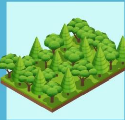
สวนป่า 1 ไร่ จำนวน 100 ต้น (อย่างไรอย่างหนึ่งหรือรวมกัน)