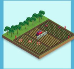
ผัก 1 งาน (อย่างไรอย่างหนึ่งหรือรวมกัน)