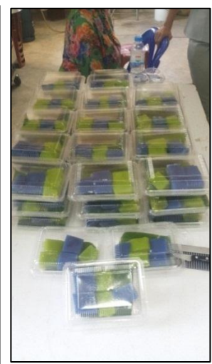
เวลา ๑๔.๑๕ น. รับประทานอาหารว่างและเครื่องดื่ม ช่วงบ่าย