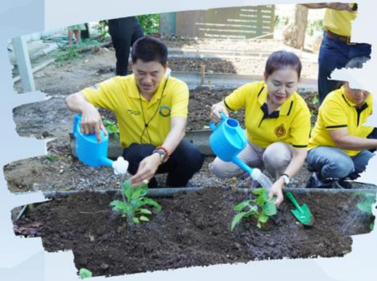
นำโดยนายกองค์การบริหารส่วนตำบลและ กำนันตำบลวังตะกั่ว

กิจกรรมปลูกผักสวนครัวเพื่อ 12 กรกฎาคม 2566 ความยั่งยืนทางอาหาร