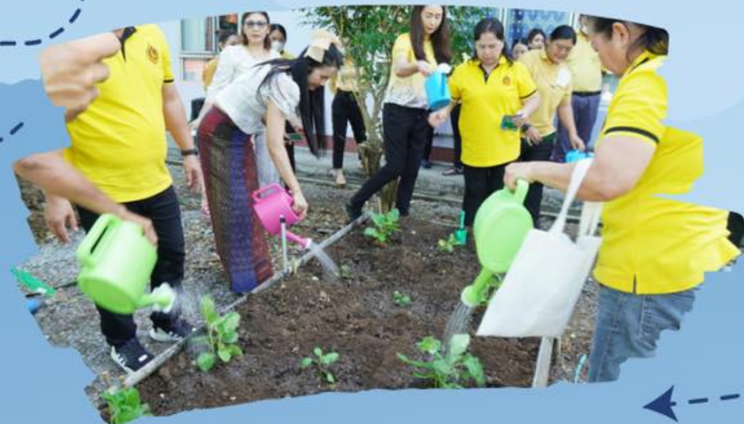
อาหารก่อกำเนิดจากดิน (Soils, where food begins)