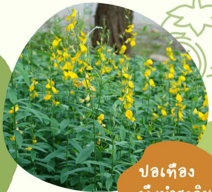
พอเที่ยง พืชบำรุงดิน