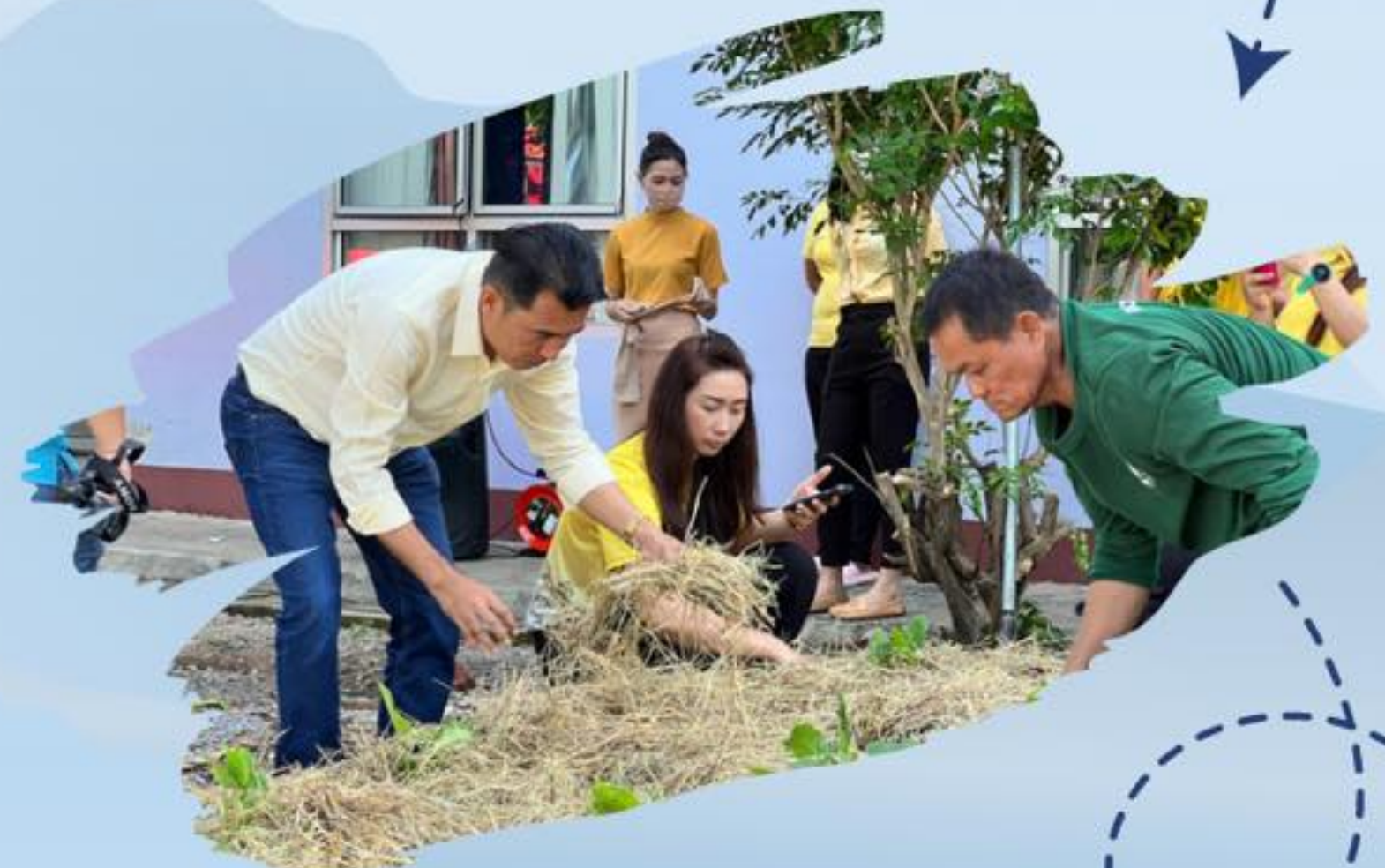
สร้างความมั่นคงทางอาหาร