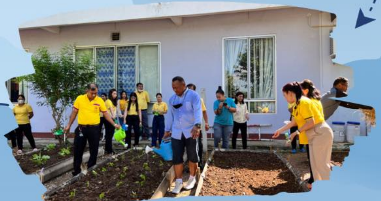
เดือนแห่งการสร้างความรู้ (Awareness Month)