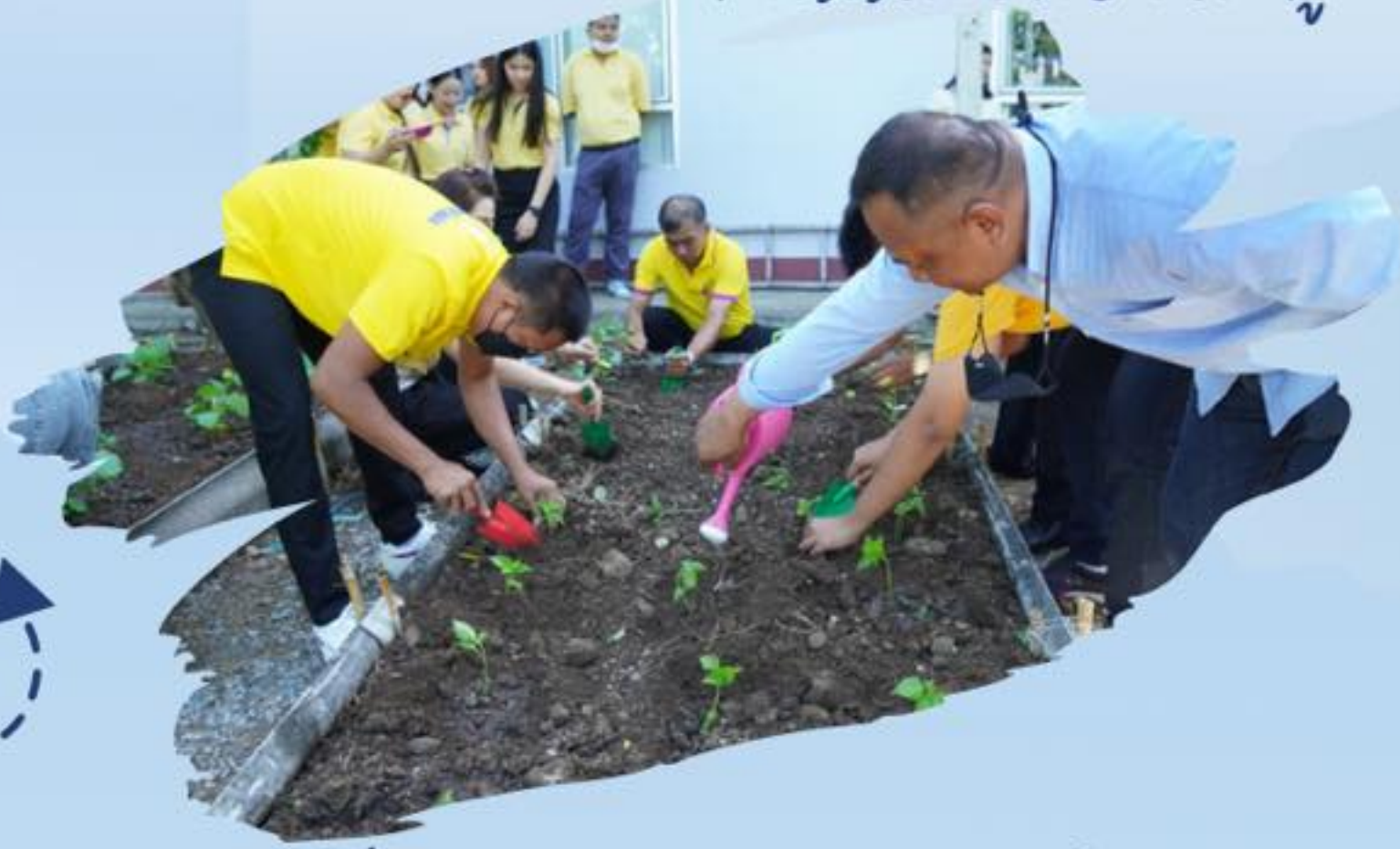
ร่วมกันปลูกผักสวนครัว