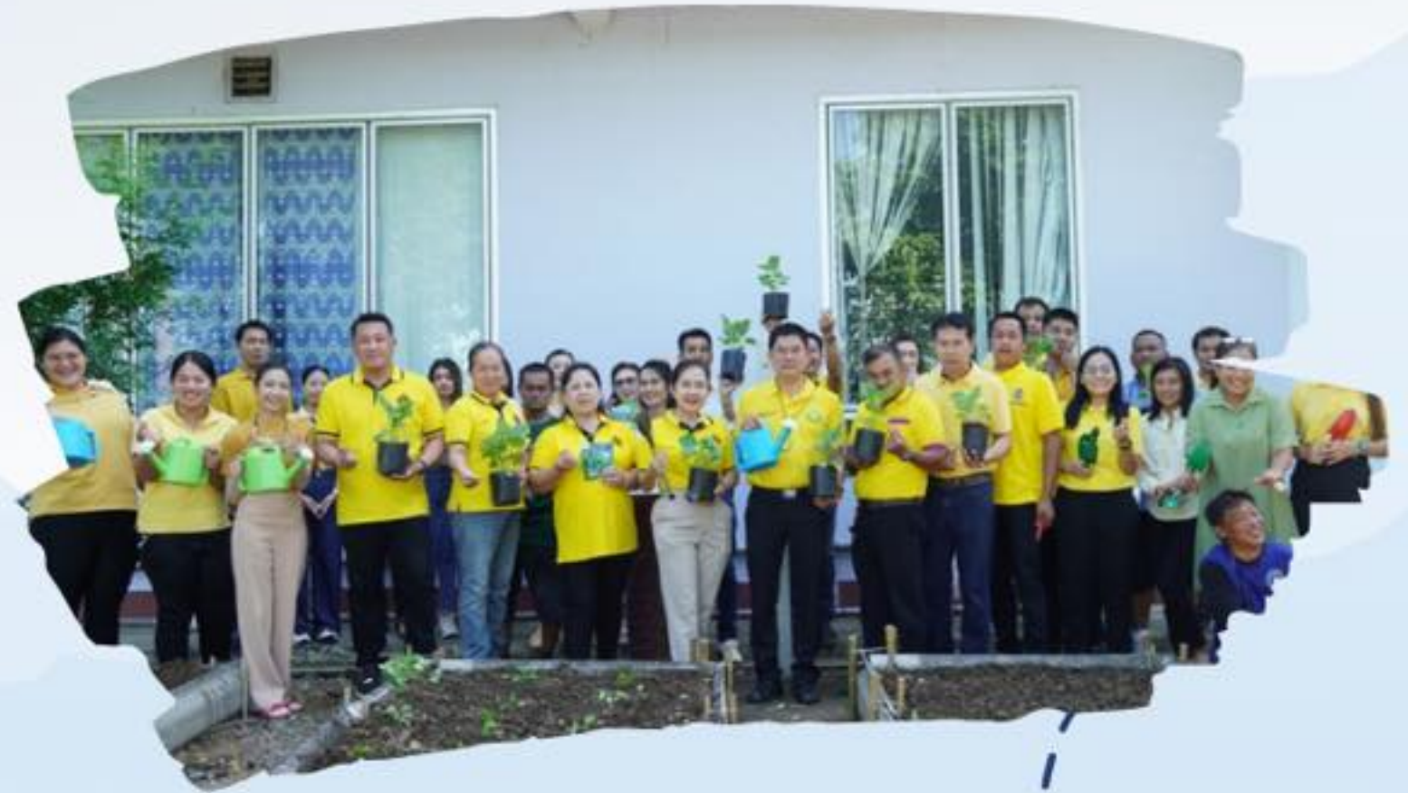
ฝ่ายบริหาร สมาชิก อบต. ฝ่ายปกครอง พนักงานส่วนตำบล