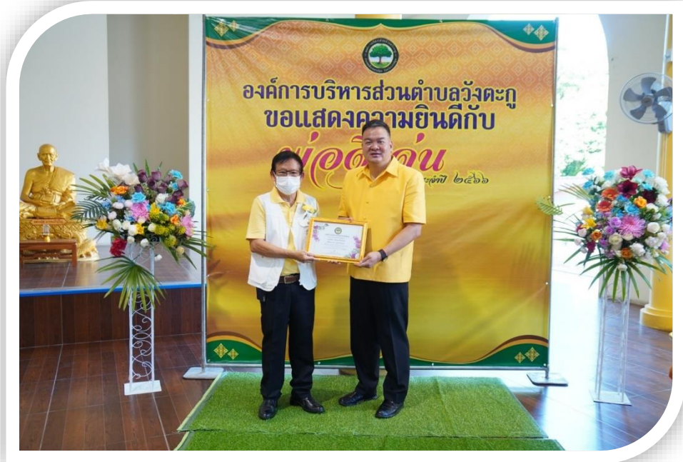
กิจกรรมพิเศษ “คนดี ศรีวังตะกุ่ม”