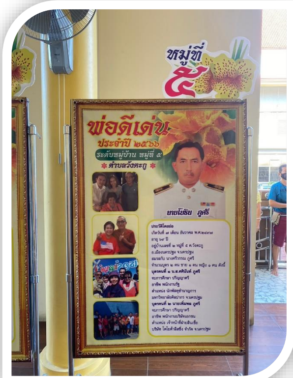
➤ ภาพนิทรรศการประวัติพ่อดีเด่นระดับหมู่บ้าน จำนวน ๘ หมู่