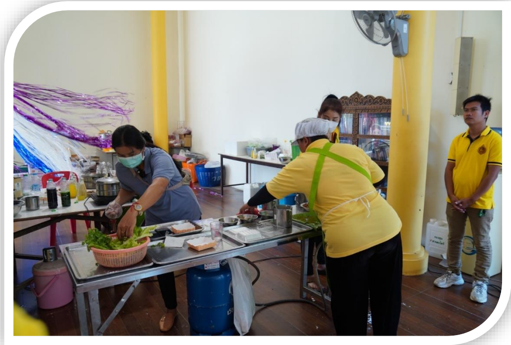
นายก อบต.วังตะกุ่ม แจกข้าวเกรียบปากหม้อ แก่ผู้เข้าร่วมกิจกรรม (งบส่วนตัว)